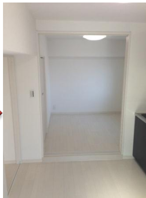
リノベーション後