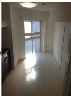
リノベーション後