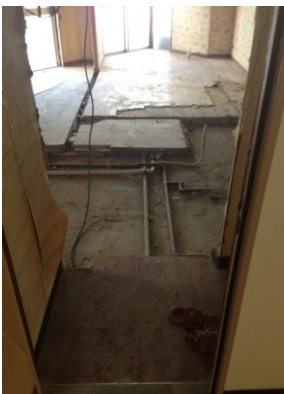
③ダイニング 工事中